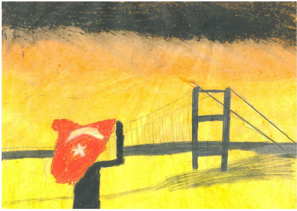
Kadir ÖZMEN 8.Sınıf