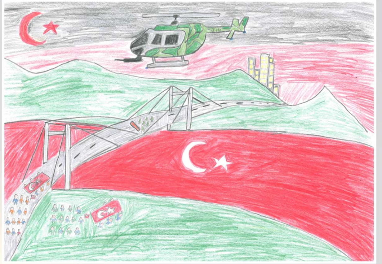
Furkan Eren SEVEN 8.Sınıf